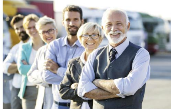
Gemeinsam für die Zukunft. Ihre Muster GmbH & Co. KG-Betriebsrente.